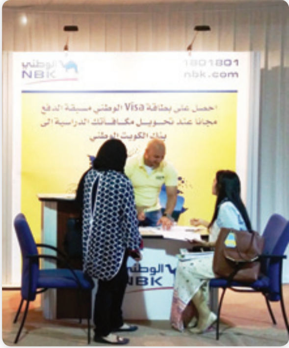
• طلاب جامعة الكويت خلال زيارة ركن «الوطني»

يرعى بنك الكويت الوطني معرض بيع الكتب الدراسية في جامعة الكويت، وتأتي هذه الرعاية في إطار حرص البنك الوطني على دعم الشباب وتلبية متطلباتهم واحتياجاتهم المالية وتوفير المزايا الحصرية التي تتناسب وأسلوب حياتهم. ويستمر المعرض لغاية يوم الثلاثاء 30 سبتمبر 2014. ويتيح البنك الوطني للشباب من خلال وجوده في جامعة الكويت التعرف على طبيعة الخدمات المصرفية المتنوعة والمختلفة التي يقدمها لهذه الشريحة، كما يعرفهم بالعروض المجزية التي يوفرها على مدار العام. وقد نجح البنك الوطني من خلال ابتكاره وتطويره الدائم للخدمات البنكية في تعزيز صدارته وموقعه المتميز محلياً من خلال أكبر شبكة فروع وقنوات توزيع في السوق المصرفية.