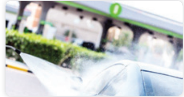
• خدمة السيارات في محطات «الأولى للوقود»

أفضل وأسرع للعملاء مما يزيد من كفاءة العمل. ومن جانبه قال الرئيس التنفيذي للشركة عادل العوضي ان «الأولى» تحرص على تطوير محطات الغسيل الآلي لكونها من الخدمات المهم للعملاء والتي تستطيع الشركة من خلالها