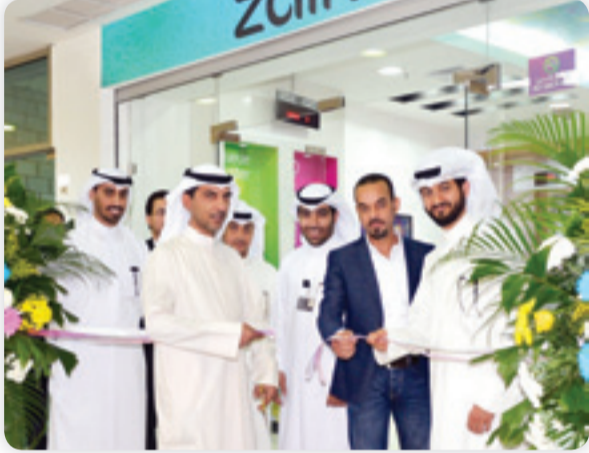
• قص شريط افتتاح فرع جديد

أعلنت شركة زين للاتصالات عن افتتاحها فرعين جديدين في كل من منطقة مبارك العبدالله ومجمع The Gate Mall بالعقيلة، وبذلك ترفع شبكة فروعها الأكثر انتشاراً في الكويت.