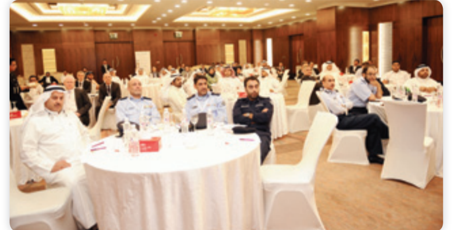
• جانب من فعاليات المؤتمر أمس